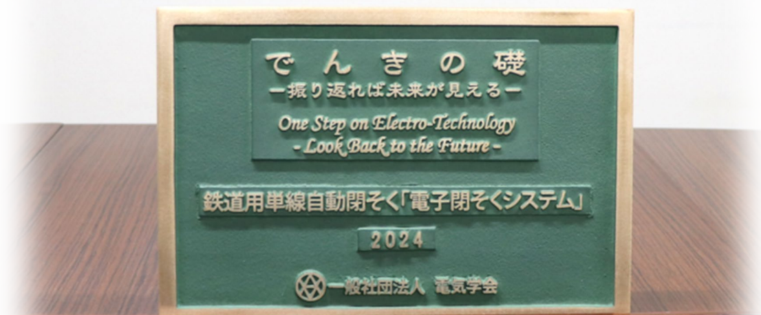
第17回「でんきの礎」記念品

なお、当該システムは、1986年から約2年間という短期間で全国19線区に導入を実現し、地方交通線の近代化と安全に大きく貢献しました。その功績が評価され、今回の顕彰に繋がりました。